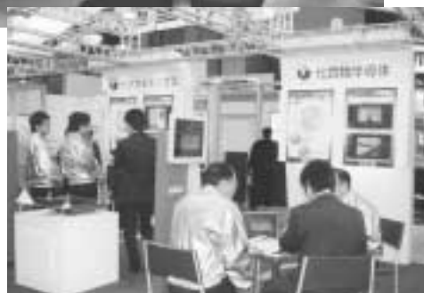
写真は前回の様子